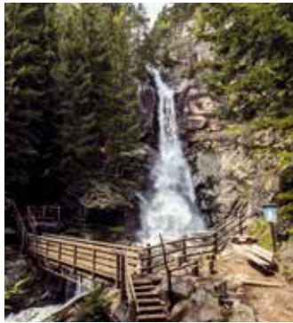
1 Barbianer Wasserfälle Cascate di Barbiano