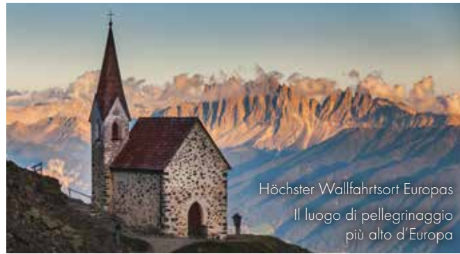
5 Latzfonsener Kreuz (2341 m) S. Croce di Lazfons (2341 m)