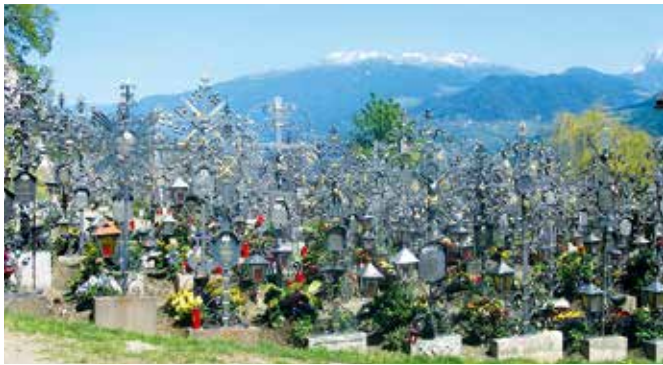
4 Schönster Friedhof Südtirols Cimitero di Villandro