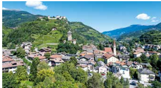
8 Künstlerstadt Klausen Città degli artisti Chiusa