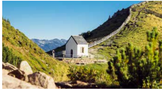
2 Toten-Kirche und Toten-See Chiesetta del Morto e lago del Morto