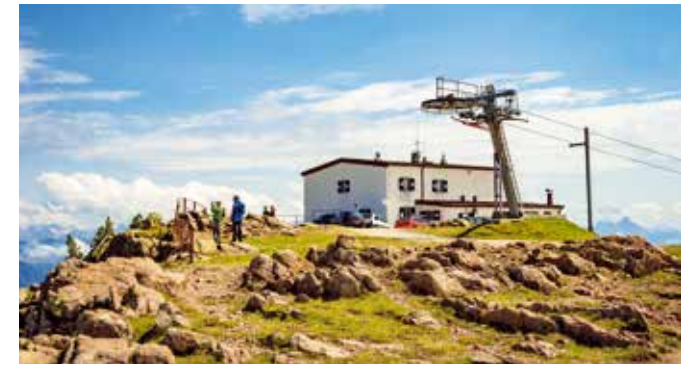
6 Rittner Horn (2260 m) Corno del Renon (2260 m)

Höchster Wallfahrtsort Europas Il luogo di pellegrinaggio più alto d'Europa