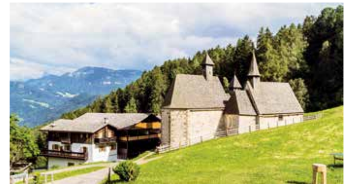
9 Bad Dreikirchen Tre Chiese