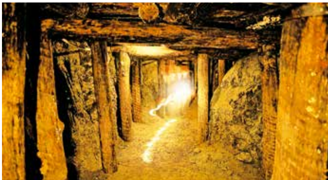
7 Erlebnisbergwerk Villanders 1 km von unserem Haus entfernt La Miniera di Villandro 1 km dal nostro hotel