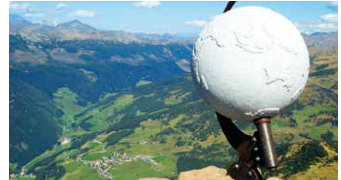
3 Villanderer Berg (2509 m) - Mittelpunkt Südtirols Villanders Monte di Villandro (2509 m) - Centro dell'Alto Adige Villandro